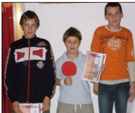
Deti sú pre dospelých príkladom, ako sa hrať