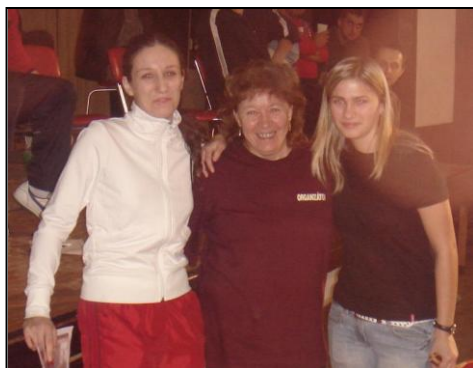
Ani ženy nezaostávajú

Je človek len racionálny a vedecký? Nepotrebuje tak náhodou aj veci, ktoré nie sú vedecké? Nepotrebuje aj umenie, pohyb, krásu...? A tak sme sa pokúsili o akciu, ktorá – zdá sa – viacerých potešila. Myslím, že sa nemusíme hanbiť – ani pred vedeckým svetom, ale ani pred športovým. To, čo sme videli sa naozaj dalo pozerat'. A dalo sa z toho tešiť.